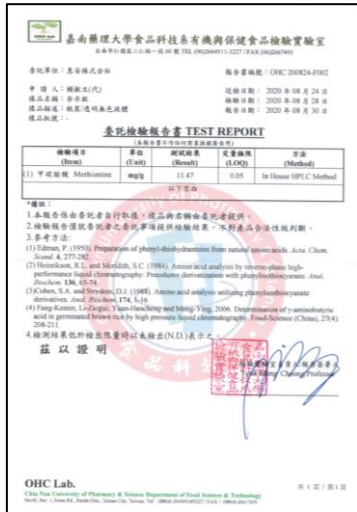
VFE 0.1μ 99%カット

一般の99%カットフィルターを謳っているマスクは3μmを指しておりますが ナノAG+AIRマスクは0.1μmの微粒子も99%カット致します。