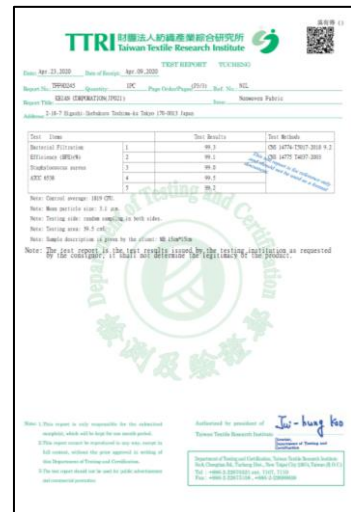
BFE 3.1μ 99%カット