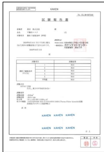
PFE 0.1μ 99%カット